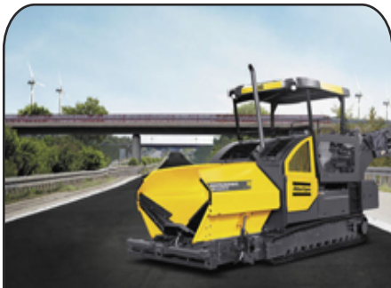
Paver Road Construction