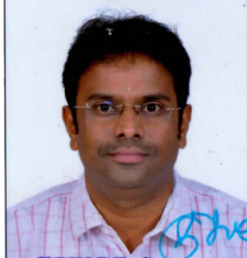
SENIOR DRAUGHTING OFFICER S/o. The Superintending Engineer, (H) NABARD & RURAL ROADS CIRCLE CHENGALPATTU